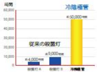
ランプの点灯壽命

冷陰極管 UVランプ採用で ON/OFF に強い長壽命 また扉の開閉などの振動にも強い高耐久性です