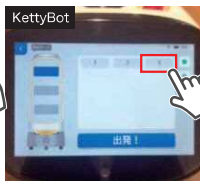
テーブル番号を選択し、「出発」をタップ