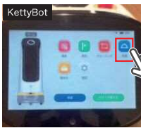
メニューから「配膳」をタップ

お客様が退店されたら、タッチパネルのメニューから「配膳」を選択し、テーブル番号をタップすると移動。食器類をトレイに載せ「完了」ボタンを押すと返却場所に戻ります。