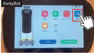
まず、メニューから「配膳」をタップ

タッチパネルのメニューから「配膳」を選択し、料理を載せてテーブル番号をタップするだけの簡単操作。お客様が料理を受け取ったら、厨房に自動的に戻ります。複数のテーブルへの配膳も可能です。