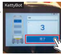
食器を載せた後、「完了」を押すと返却場所に移動