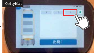
テーブル番号を選択するだけの簡単操作