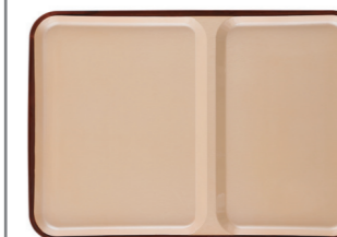
ベージュ測べっ甲