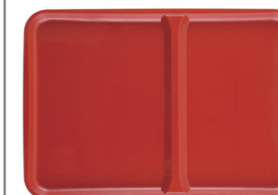
朱ベタ塗梨地(粒あり)