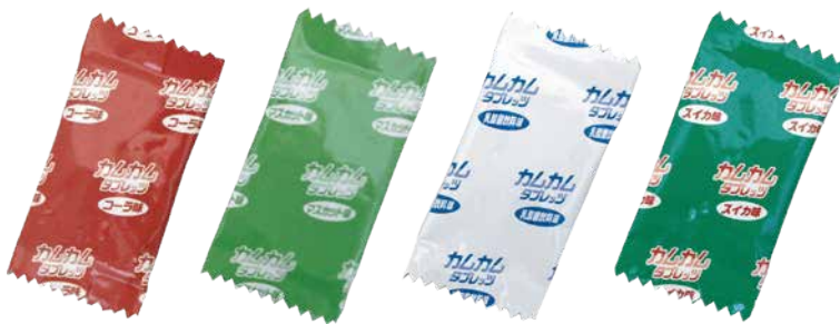
コーラ味 マスカット味 乳酸菌飲料味 スイカ味