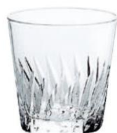
T-20105HS-2 7オールド ¥1,200 (税込¥1,320) 48コ入(6×8)